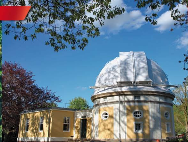
Das Café Raum & Zeit im Besucherzentrum am 1m-Spiegel-Gebäude ist der zentrale Anlaufpunkt für Führungen und die meisten Veranstaltungen.

Die Hamburger Sternwarte in Bergedorf hat mit Unterstützung des Senats einen Antrag auf Aufnahme in die UNESCO-Liste der Weltkulturerbe gestellt.